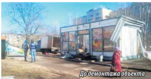
До демонтажа объекта