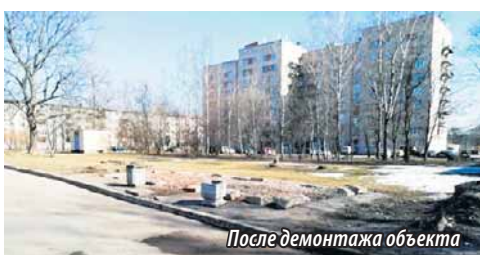
После демонтажа объекта

В конце марта 2019 года начались работы по демонтажу нестационарного торгового объекта расположенного рядом с домом 27, корпус 2 по улице Карпинского.